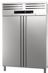
Réfrigération - Green line - Armoires de stockage Gastronorm GN2/1 - Armoires froides positives 1400L