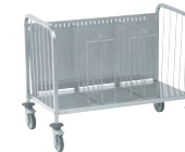
CHARIOT PORTE-ASSIETTES Réf : 800551 Dim. 1 065 x 740 x 810 mm