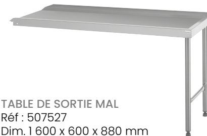
TABLE DE SORTIE MAL Réf : 507527 Dim. 1 600 x 600 x 880 mm