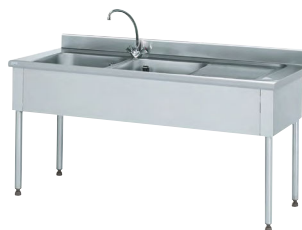
PLONGE STANDARD Réf : 816674 Dim. 1 800 x 700 x 900 mm