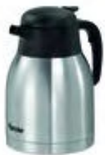
Bartscher CAFETIÈRE THERMOS Réf : 190114 Capacité : 1.5 L Dim. 170 x 140 x 215 mm