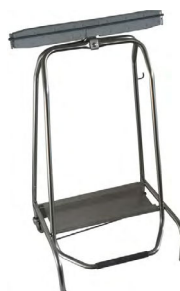
SUPPORT SAC POUBELLES Réf : 804453 Inox 110 L Dim. 580 x 420 x 960 mm