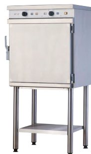
FOUR 705 R'T 5 NIVEAUX GN 1/1 Avec support monte commande électromécanique Réf : CFE705RT Électrique, 6 000 Watts Dim. 750 x 700 x 1 550 mm