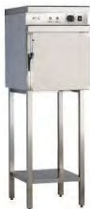
FOUR 505 RTS 5 NIVEAUX Réf : CFE505RT Électrique, 2 500 Watts Dim. 500 x 650 x 650 mm