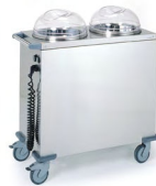
CHARIOT ASSIETTES À NIVEAUX CONSTANT Réf : 808172 Dim. 960 x 485 x 900 mm