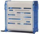
DÉSINSECTISEUR FLYINBOX Réf : FX20IB Surface d'application 50 m 2 Electrique, 20 Watts Dim. 265 x 125 x 260 mm