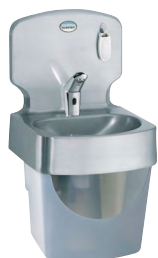
LAVE-MAINS AVEC DOSSERET Réf : 806301E