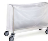
HOUSSE PVC CHARIOT PORTE-ASSIETTES Réf : 228198 Capacité : 400 assiettes