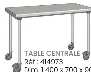
TABLE CENTRALE SUR ROUE STANDARD Réf : 414973 Dim. 1 400 x 700 x 900 mm