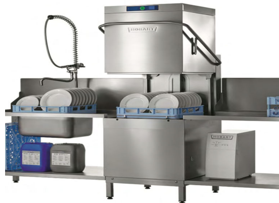
HOBART MACHINE À LAVER À CAPOT ISOLÉ Réf : AMXXS-10B Jusqu'à 70 casiers/h Adoucisseur intégré Dim. 711 x 815 x 1 995 mm