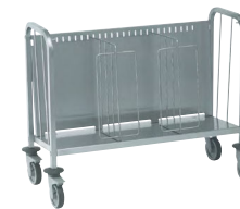
CHARIOT PORTE-ASSIETTES SÉPARATEUR ANTI-CHUTES Réf : 800541 Dim. 1 065 x 450 x 810 mm