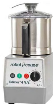
BLIXER 4 V.V. Réf : 33280 Capacité Cuve : 4.5 L Portions : de 2 à 15 Électrique, 1100 Watts Dim. 300 x 400 x 540 mm