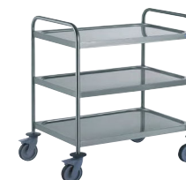
CHARIOT À DEBARRASSER AVEC 2 ARCEAUX Réf : 801543 Dim. 895 x 625 x 960 mm