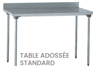
TABLE ADOSSÉE STANDARD Réf : 503224 Dim. 1 400 x 700 x 900 mm