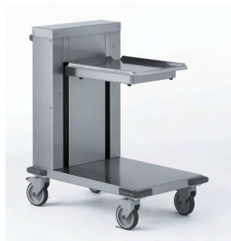
CHARIOT À NIVEAUX CONSTANTS Réf : 808102 Dim. 815 x 545 x 930 mm