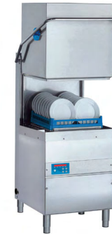
DIHR we mean clean LAVE VAISSELLE À CAPOT Réf : HT12 ÉLECTRON 2 électrique, 10 490 Watts Dim. 720 x 735 x 1880 mm