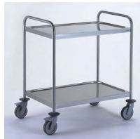
CHARIOT À DEBARRASSER AVEC 2 ARCEAUX Réf : 801542 Dim. 895 x 625 x 960 mm