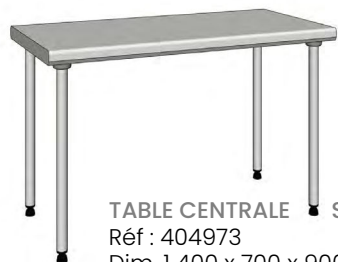
TABLE CENTRALE STANDARD Réf : 404973 Dim. 1 400 x 700 x 900 mm