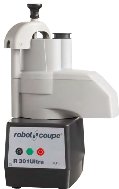
COMBINE CUTTER/COUPE-LÉGUMES R301 ULTRA Réf : 2546 Électrique, 230 Watts Dim. 355 x 305 x 570 mm