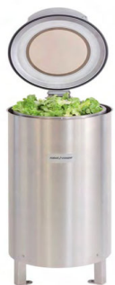
ESSOREUSE ÉLECTRIQUE Réf : 46390 Électrique, 370 Watts Dim. 500 x 980 x 1 070 mm