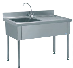
PLONGE STANDARD Réf : 816681 Dim. 1 400 x 700 x 900 mm