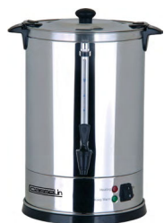
casselin PERCOLATEUR À CAFÉ Réf : CPC100 100 Tasses Electrique, 1 650 Watts