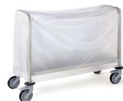
HOUSSE PVC CHARIOT PORTE-ASSIETTES Réf : 228196 Capacité : 200 assiettes