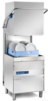
DIHR we mean clean LAVE VAISSELLE À CAPOT Réf : HT11 Électrique, 10 120 Watts Dim. 720 x 584 x 537 mm