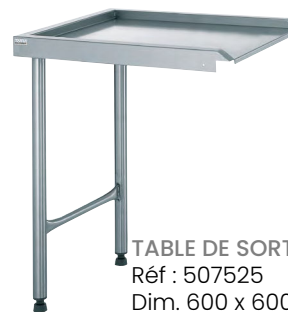
TABLE DE SORTIE MAL Réf : 507525 Dim. 600 x 600 x 880 mm