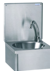
LAVE-MAINS AVEC DOSSERET Réf : 806332E