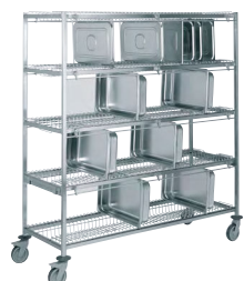
CHARIOT PORTE-BACS GASTRONORME Réf : 805606 Dim. 1 670 x 620 x 1 705 mm