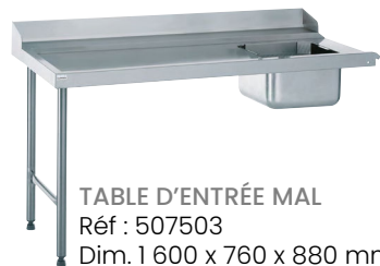
TABLE D'ENTRÉE MAL Réf : 507503 Dim. 1 600 x 760 x 880 mm