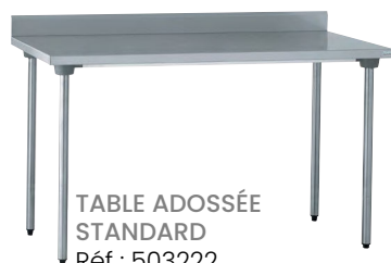
TABLE ADOSSÉE STANDARD Réf : 503222 Dim. 1 000 x 700 x 900 mm