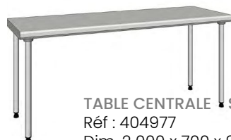
TABLE CENTRALE STANDARD Réf : 404977 Dim. 2 000 x 700 x 900 mm