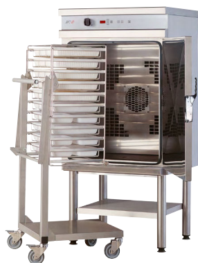
FOUR 710 R'T 10 NIVEAUX GN 1/1 Réf : CFE710RT Électrique, 9 000 Watts Dim. 750 x 700 x 1 770 mm