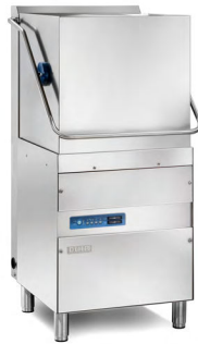
DIHR we mean clean LAVE VAISSELLE À CAPOT Réf : HT11D Électrique, 10 120 Watts Dim. 720 x 735 x 537 mm