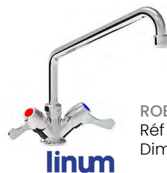
ROBINET MELANGEUR MONOTROU Réf : LKF-1414 Dim. 427 x 171 x 92 mm