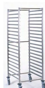
CHARIOT À GLISSIÈRE GASTRONORME Réf : 804239 Dim. 773 x 659 x 1 785 mm