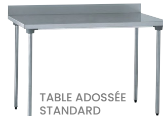
TABLE ADOSSÉE STANDARD Réf : 503227 Dim. 1 800 x 700 x 900 mm