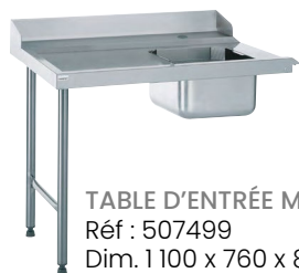
TABLE D'ENTRÉE MAL Réf : 507499 Dim. 1 100 x 760 x 880 mm