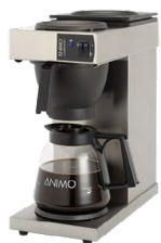
ANIMO MACHINE À CAFÉ VERSEUSE Réf : 10380 Électrique, 2 100 Watts Dim. 190 x 370 x 433 mm