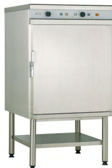
FOUR 720 R'T 20 NIVEAUX GN 1/1 Réf : CFE720RT Électrique, 18 000 Watts Dim. 890 x 1 030 x 1 770 mm