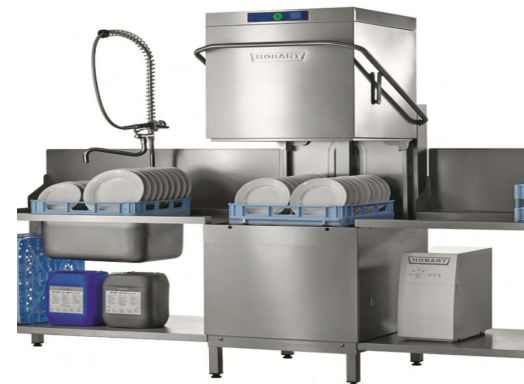
HOBART MACHINE À LAVER À CAPOT ISOLÉ Réf : AMXX-10B Jusqu'à 70 casiers/h Dim. 711 x 815 x 1 995 mm