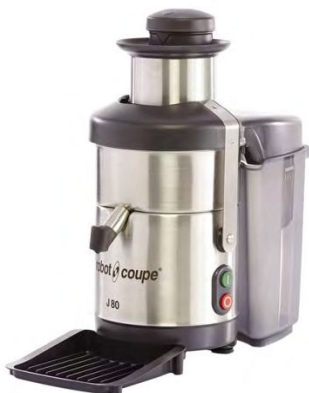
EXTRATEUR DE JUS AUTOMATIQUE J80 Réf : 56200B Électrique, 700 Watts Dim. 235 x 535 x 500 mm