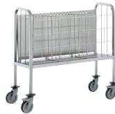
CHARIOT PORTE-ASSIETTES Réf : 800578 Dim. 1 065 x 450 x 1 000 mm